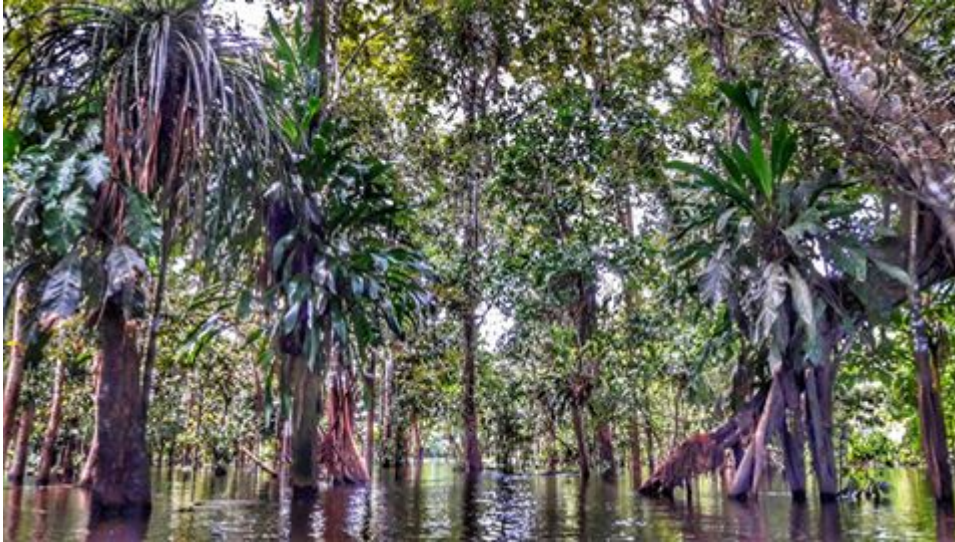
Navegando por la selva inundable o zonas varseas