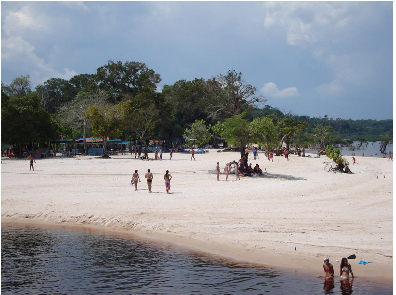
Temporada de Playas

La temporada de aguas bajas comienza desde finales de Junio hasta mediados de Enero. En esta temporada, el río Amazonas baja más de 20 metros y crea diferentes playas para disfrutar. Aquí se puede hacer más actividades de trekking y comienza la temporada de pesca de piraña.