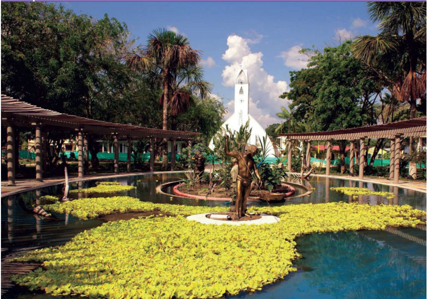
Parque Santander en Leticia Amazonas

No existe en el Amazonas una mejor temporada para visitar esta región. Cada temporada en el Amazonas ofrece a los visitantes muchas razones para visitarla. Leticia Amazonas, es una ciudad ubicada en medio de la selva amazónica. Tiene un promedio de 40.000 habitantes y más de 70 comunidades nativas diferentes. Nuestra ciudad se encuentra a orillas del poderoso río Amazonas con una extensión de 104 km. En esta región, sólo tenemos 2 temporadas que son “Temporada Alta de Agua” y “Temporada Baja de Agua”. Recuerde, estamos en un bosque lluvioso, lo que significa que puede llover fácilmente.